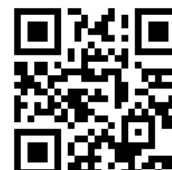
ひとり親家庭支援センター 公式LINEの登録