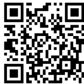
イベント参加申込フォーム ①、②、③、⑥ 専用