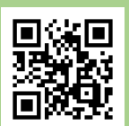
募集要項説明動画 https://youtu.be/YLAfzePhKl8