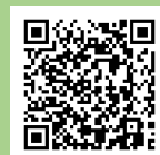
申込フォーム用 QRコード

申込方法：専用の申し込みフォーム ⇒ https://cutt.ly/Jzee54T